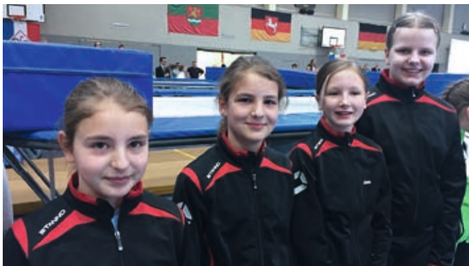
Ein toller Erfolg für die Hemminger Trampolinspringerinnen. Thorsten Langner