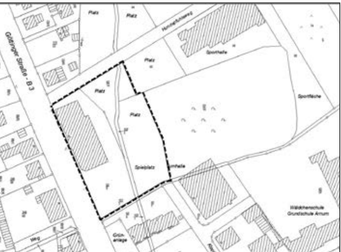
Quelle: ALK-Daten der Niedersächsischen Vermessungs- und Katasterverwaltung

(Der Geltungsbereich ist mit einer dicken unterbrochenen Linie gekennzeichnet.)