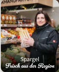
Spargel Frisch aus der Region