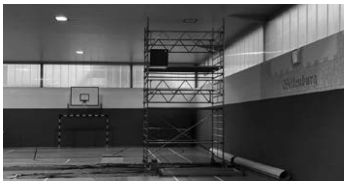
Rechtzeitig zu den kom- menden Heimspielen der Tischtennis-Sparte erstrahlt die Hallenbeleuchtung wieder in voller Stärke.