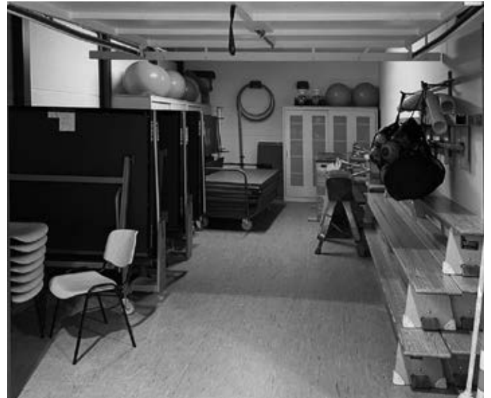
Auch der Geräteraum in der Mehrzweckhalle wurde von den fleißigen Helfern gründlich aufgeräumt.