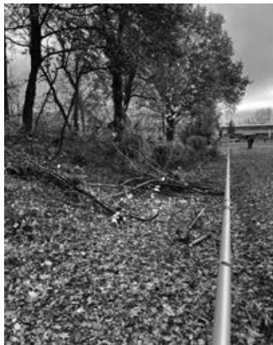
Die an das Spielfeld angrenzende Grünfläche wurde enorm ausgedünnt und zurückgeschnitten.