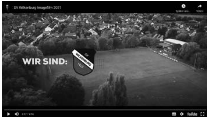
Das Titelbild des neuen Imagefilms „Wir sind: SV Wilkenburg“