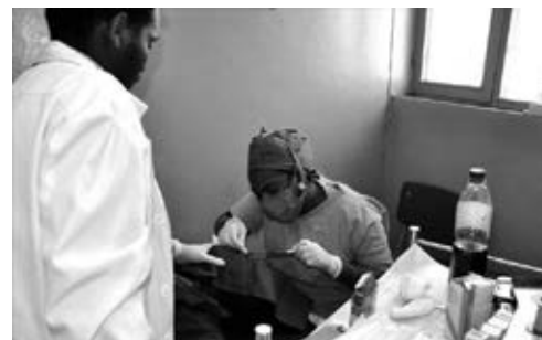
Trachom-OP, eingearbeitete K.-Schwester

Nicht nur die Not der um sich greifenden Trachom-Augenerkrankung, die zur Erblindung führt, fordert unsere Hilfe heraus, es ist zugleich die verbreitete bittere Armut dieser ca. 114.000 Einwohner zählenden Hochland-Region, die viele Männer zur Abwanderung und Suche nach wenigstens etwas besseren Einkünften für ihre Familien zwingt – oft erfolglos: