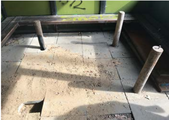
Nur noch Bank- und Tischfragmente