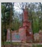
Mausoleum Carl von Alten / Im Sundern Geöffnet: 11.00 – 15.00 Uhr