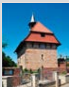
Kapelle Harkenbleck Geöffnet: 11.30 – 17.00 Uhr