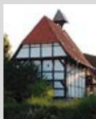
Kapelle Devese Geöffnet: 11.00 – 15.00 Uhr