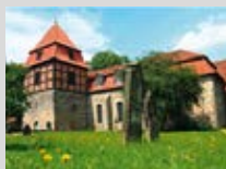
St.-Vitus-Kirche Geöffnet: 11.00 – 16.30 Uhr