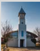
Friedenskirche Arnum Geöffnet: 11.00 – 17.00 Uhr