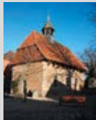
Kapelle Hemmingen Geöffnet: 11.00 – 15.00 Uhr

Eine Initiative der Stadt Hemmingen und der ökumenischen Kirchenregion Hemmingen