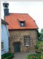
Wehrkapelle Maria Magdalena Geöffnet: 10.00 – 18.00 Uhr