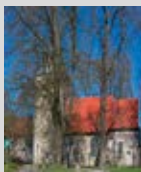
Nikolaikirche Hiddestorf Geöffnet: 11.00 – 16.30 Uhr