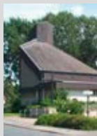
Kirche St. Johannes Bosco Geöffnet: 11.00 – 17.00 Uhr