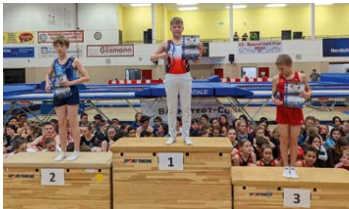
Trampolin in Hemmingen – saustark.

Da war die Freude groß, dass erstmalig ein Hemminger Trampoliner den Siegerpokal beim Barmstedt-Cup hochhalten konnte. Der derzeit beste deutsche Trampolinspringer in der Altersklasse 2010/2011 und 6. bester der Welt zeigte auch zum Wettkampfauftritt 2023 starke Übungen. Seine Finalkür mit 4 Doppelsalti klappte sehr gut, und so gewann er die Konkurrenz 2010/2009 gegen die Trampoliner aus Deutschland und Holland souverän.