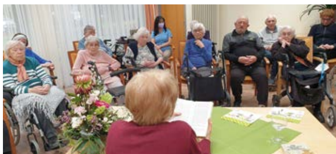
Zur Februar-Lesung im Pflegeheim fanden sich 14 betagte Zuhörerinnen und Zuhörer ein – und hörten eine knappe Stunde lang mucksmäuschenstill zu.

Nähere Informationen zu weiteren Angeboten, aktuellen Terminen und geplanten Vorhaben rund um die Hemminger Bürgerstiftung sind im Internet unter www.buergerstiftung-hemmingen.de zu finden.