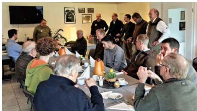
Der Hegeringleiter gibt die Streckenmeldungen bekannt ...