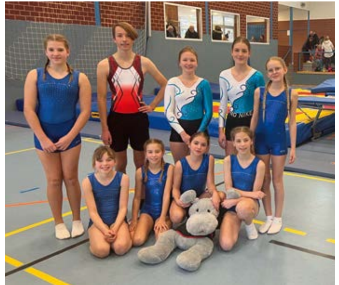
Trampolin in Hemmingen: vielseitig...

Mit 9 Teilnehmern war der SC Hemmingen-Westerfeld sehr zahlreich und erfolgreich bei den Landesdoppelminimeisterschaften in Schleddehausen bei Osnabrück vertreten.