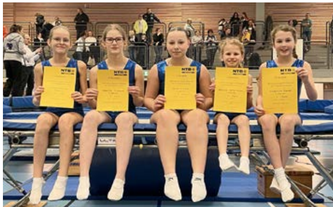
Trampolin in Hemmingen – die Wettkampfsaison ist gestartet.