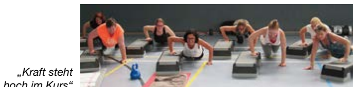
„Kraft steht hoch im Kurs“