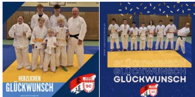
Bildquelle: SC Hemmingen-Westerfeld v. 1914 e.V.

Noch mehr Infos findet ihr auf der Webseite der Judosparte unter www.judo-hemmingen.de oder auf Instagram unter sc_hemmingen_judo!