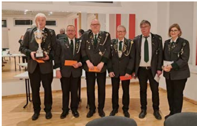
Foto: Die glücklichen Sieger im Jörg-Hartzke-Pokal.