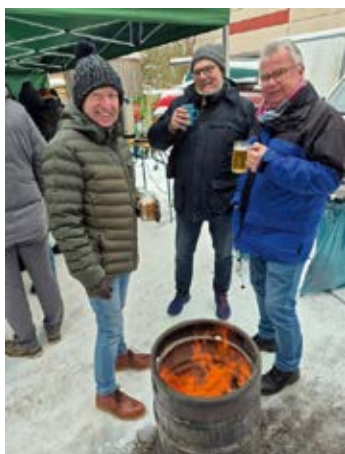
Foto: An grillen um die Feuertonne am 1. Februar 2026

Bürgerschießen 2026: Am Samstag den 18. April von 15:00 – 18:00 Uhr und am Sonntag den 19. April von 11:00 – 14:00 Uhr findet auch dieses Jahr wieder das traditionelle Bürgerschießen der Schützengesellschaft Hemmingen statt. Wir laden dazu herzlich alle Hemminger Bürger ein und bitten um zahlreiche Teilnahme.