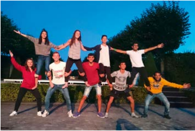
Die Jugendlichen aus Rumänien zeigen spontan ihre akrobatischen Künste im großen Garten in Herrenhausen.