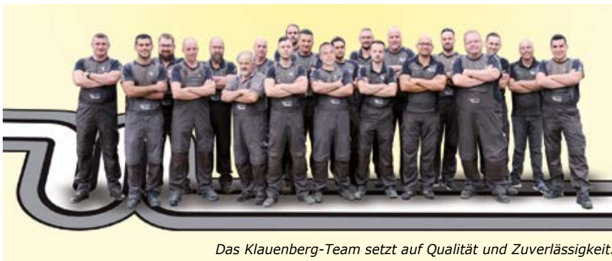
Das Klauenberg-Team setzt auf Qualität und Zuverlässigkeit.

Weitere Informationen gibt es im Betrieb an der Wilhelm-Röntgen-Straße 1 in Hemmingen, unter Telefon (05 11) 82 79 89, per E-Mail an info@klauenberg-rks.de sowie im Internet unter www.ist-dein-rohr-frei.de .