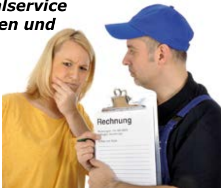
Rechtzeitig achtsam sein, um böse Überraschungen bei der Rechnung zu vermeiden.

Deshalb rät er allen potenziellen Kunden, sich vorab genau zu informieren und darauf zu achten, auf welcher Internetseite man sich gerade befindet. „Man muss da ganz genau aufpassen.“ Unter www.ist-dein-rohr-frei.de ist die Firma Klauenberg mit der Auflistung sämtlicher Tätigkeitsfelder zu finden. Nur diese Seite betreibt der Fachbetrieb für Rohr- und Kanalservice. Die Tele-