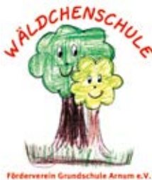
Förderverein Grundschule Arnum e.V.

Der Förderverein blickt mit Zuversicht nach vorn: Auch 2025 werden wir