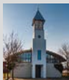
Friedenskirche Arnum 11.00 – 17.00 Uhr