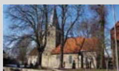
Nikolaikirche Hiddestorf, 11.00 – 16.00 Uhr