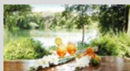
Shinebar, 12.00 – 22.00 Uhr