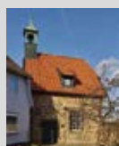
Wehrkapelle Maria Magdalena 10.00 – 18.00 Uhr