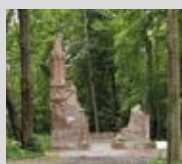
Mausoleum Carl von Alten 11.00 – 17.00 Uhr