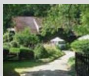
Café Webstuhl 14.00 – 18.00 Uhr