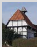
Kapelle Devese 11.00 – 15.00 Uhr