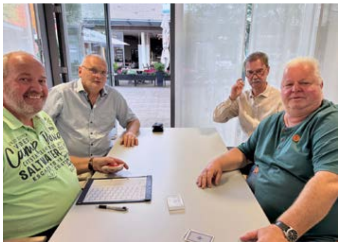
Wir freuen uns auf Skat mit Kindern.