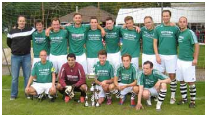
Stadtmeister 2012 im Fußball: SV Arnum