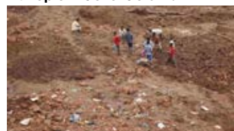
Bild: Äthiopien * Erdbeben-Katastrophe im Süd-Westen: im Geze-Gofa-Gebiet am 21.07.2024

Über 5.000 Menschen waren obdachlos, darunter ca. 1.700 Kinder und ohne Nahrungsmittel und den Naturgewalten ausgesetzt.