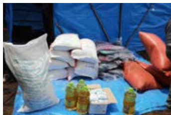
Bild: Äthiopien-Geze-Gofa: Nothilfe-Rationen

75 Tonnen Maismehl, 7,5 Tonnen Hülsenfrüchte, 2.500 Liter Speiseöl, außerdem 7,5 Tonnen Famix für besonders bedürftige Personen, Kinder unter fünf Jahren, stillende Mütter und Schwangere. Unter den 5.000 obdachlosen Menschen waren 1.700 Personen, die Ergänzungsnahrung benötigen: 1.300 Kinder unter fünf Jahren und 400 stillende Mütter und Schwangere