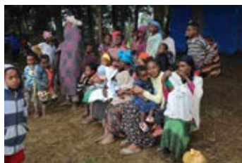
Bild: Äthiopien, Obdachlose der Erdbeben-Katastrophe vor der Ausgabe der Nothilfe (Geze-Gofa-Gebiet)

Die Karlheinz-Böhm-Stiftung „Menschen für Menschen“ leistete erste Hilfe und kooperierend die Friedrich-Wolter-Stiftung mit dem Nahziel über einen Monat Überleben zu sichern mit Zeltunterkünften Nahrung und Sicherungslogistik – ein geschätzter Kostenumfang von mehr als 130.000 Euro.